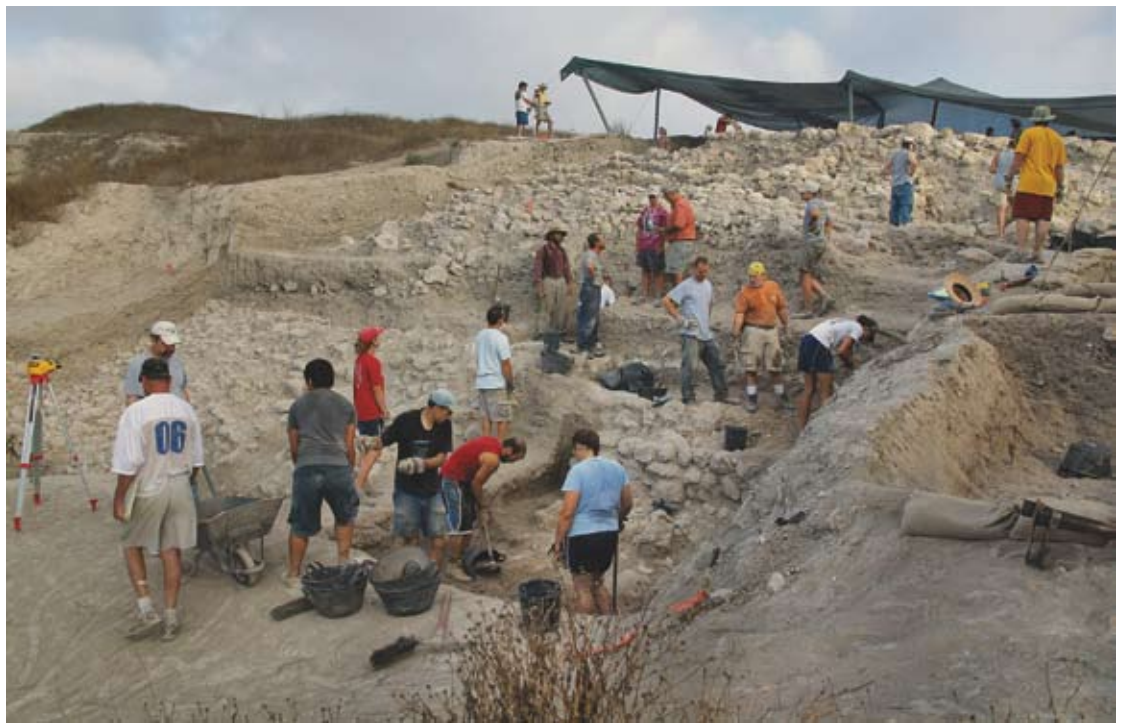
Ανασκαφή στην κάτω αγορά της αρχαίας Εφέσου

Ο όρος «βιβλική αρχαιολογία» συνδυάζει δύο διαφορετικούς τομείς: τη Βίβλο από τη μία και την αρχαιολογία από την άλλη. Αρχικώς, αυτή η εκδοχή της αρχαιολογίας εμφανίστηκε να αποτελεί κλάδο των βιβλικών σπουδών, αφού το ενδιαφέρον της συγκεκριμένης αρχαιολογικής κατεύθυνσης εστιαζόταν μόνο στη γη του Ισραήλ και τις γειτονικές του