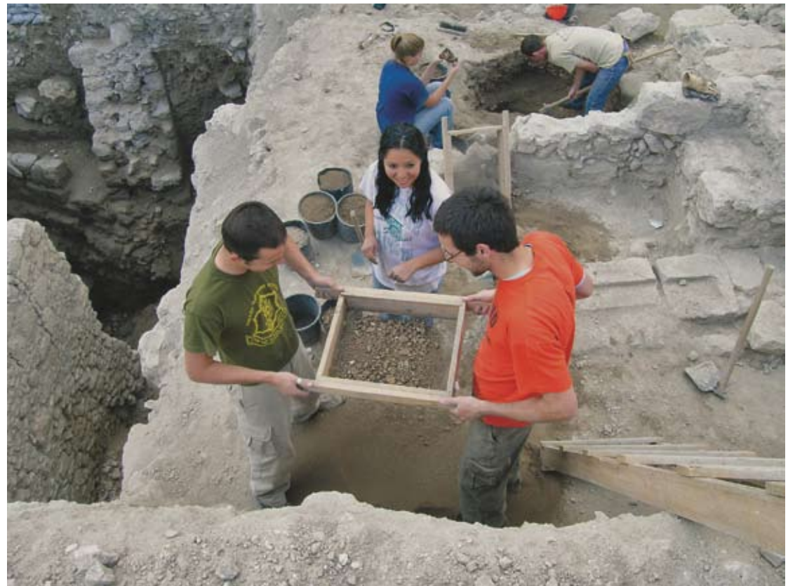
Εθελοντές φοιτητές την ώρα εργασίας κατά την ανασκαφή στην πόλη του Δαυΐδ

Ένα πρόσφατο μέσο προβολής του έργου της αρχαιολογικής έρευνας, αλλά και προϊόν της συνεργασίας της αρχαιολογίας με τη βιβλική θεολογία και επιστήμονες από άλλους χώρους είναι τα διάφορα ντοκιμαντέρ. Αρκετά εκπαιδευτικά τέτοια ντοκιμαντέρ άρχισαν να προβάλλονται αρχικώς στα